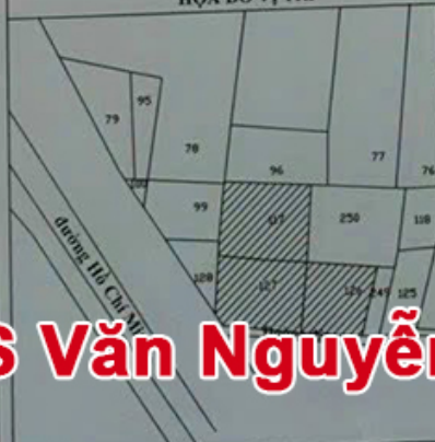
HỌA ĐỒ VỊ TRÍ